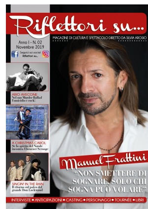
Riflettori su Magazine: numero di novembre