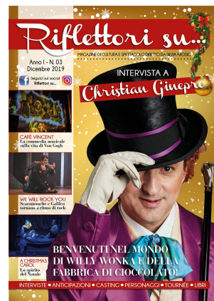
Riflettori su Magazine: numero di dicembre

Riflettori su Magazine: numero di novembre