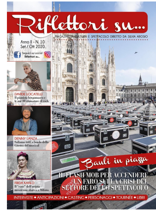
Riflettori su di settembre/ottobre