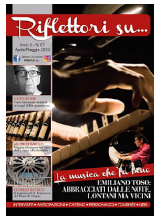
Riflettori su Magazine: numerodi aprile/maggio