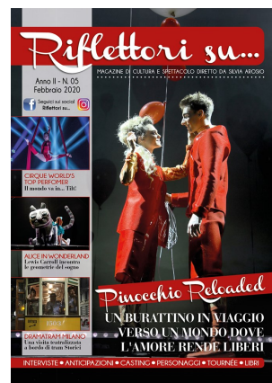
Riflettori su Magazine: numero di febbraio