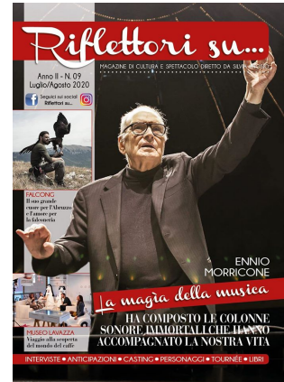
Riflettori su luglio/agosto