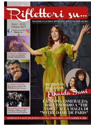
Magazine mensile di RIFLETTORI SU