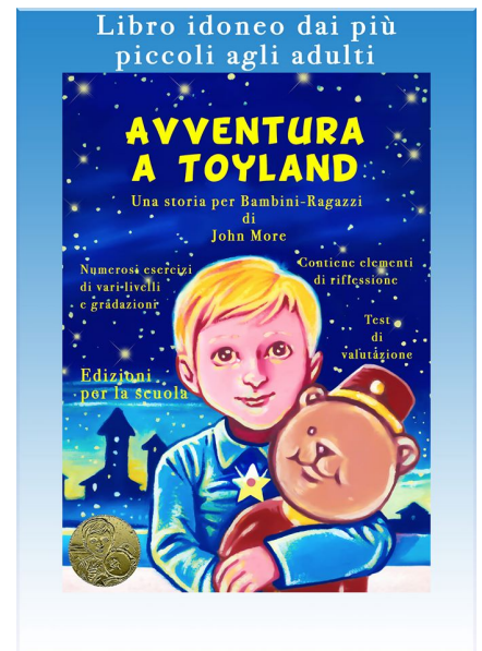
Avventura a Toyland