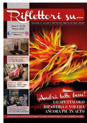
Riflettori su Magazine: numero di marzo

Riflettori su Magazine: numero di febbraio