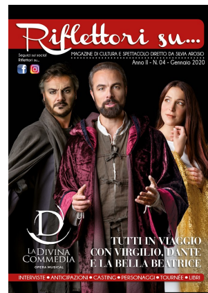
Riflettori su Magazine, gennaio 2020

Riflettori su Magazine: numero di dicembre